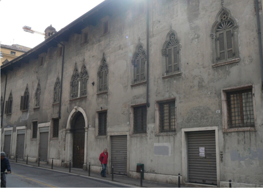
foto palazzo su via S. Paolo

Il progetto in oggetto non prevede interventi sulle facciate su via S. Paolo e sul cortile interno.